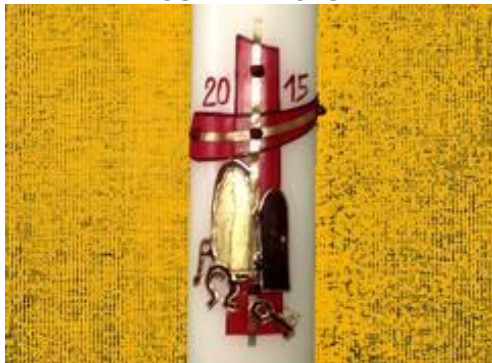
Osterkerze 2015 | von Sr. Bernadette

Der Mensch braucht Erinnerung... sonst vergisst er, woher er kommt und wohin er geht.