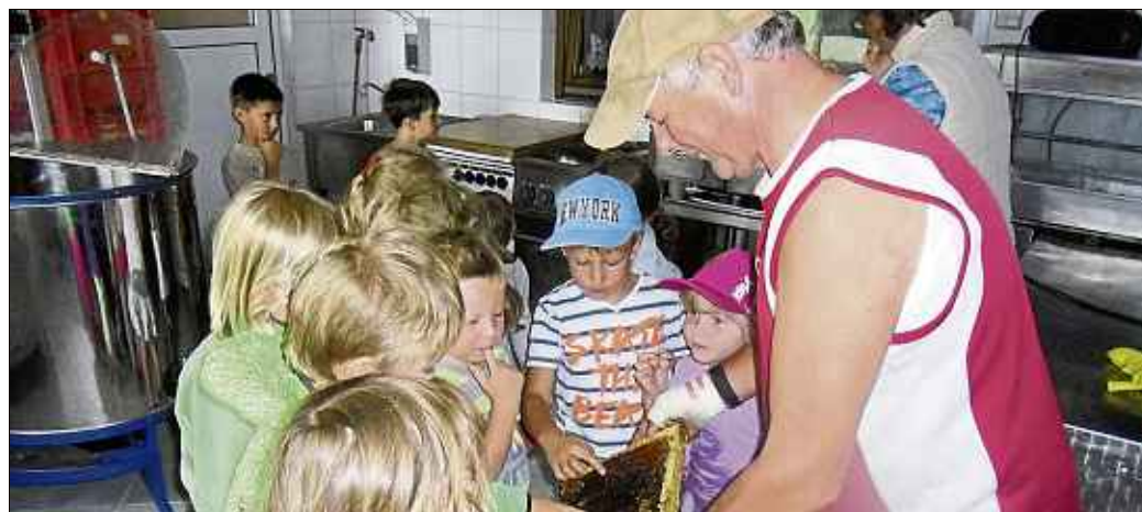
Die Jungs und Mädchen dürfen den Honig auch gleich probieren.

Die Kinder haben bei diesem Ausflug viel über Akzeptanz und Achtsamkeit gegenüber jedem noch so kleinen Lebewesen gelernt, so das Resümee.